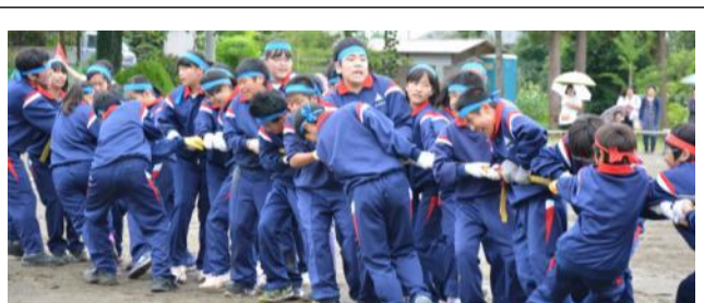
1年学年競技、頭脳戦と体力勝負の「ヒッパレー」