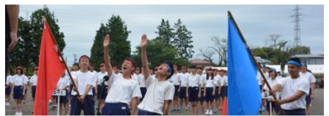
赤組青組代表応援団長の高らかな選手宣誓