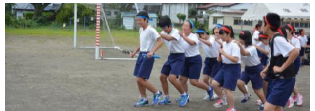
3年学年競技ムカデ競走も呼吸合わせが大変