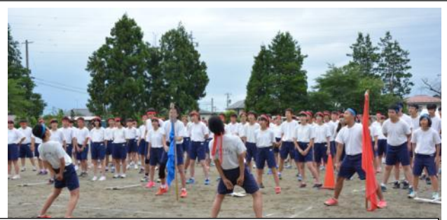
ハチマキと応援旗を交換しあい、校歌を熱唱