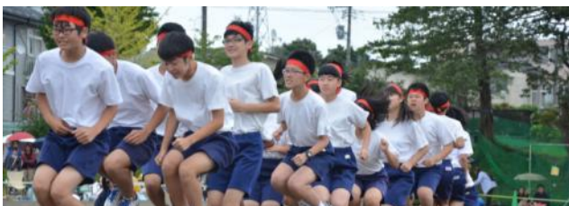
長縄飛び、連続60回を超えて会場からは拍手も