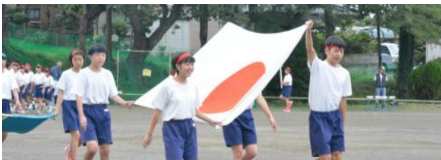
花火の合図とともに始まった入場行進

各地区の保護者、地域の皆さまには早朝よりご来場いただき、最後まで温かなご声援をいただきありがとうございました。閉会式では互いの健闘をたたえ合う三中生の姿がありました。三中生が素直で爽やかな心をこの体育祭で体現できたのも皆さまのご理解とご支援の賜物と感謝しております。今年の夏を締めくくる素晴らしい体育祭となりました。次の三中行事は合唱コンクールです。来る10月11日(水)に多賀城文化センターで開催します。最優秀賞を目指し、三中生はまた新たな目標に向かって前進します。