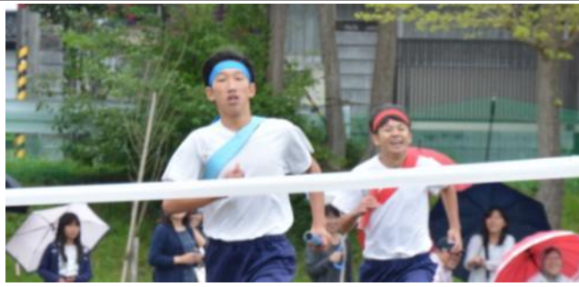
息をもつかせぬスピード勝負のクラス対抗リレー