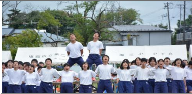
応援合戦、青組の演技中は赤組が声援を