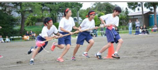
2年学年競技、遠心力で足がもつれそうに