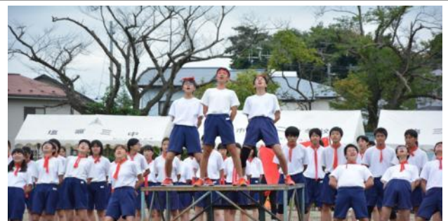
応援合戦、赤組の演技中は青組が声援を