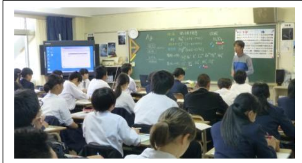
電子黒板を使っでの授業の様子です。