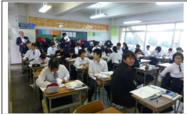
小学校の先生に久しぶりに会いました。