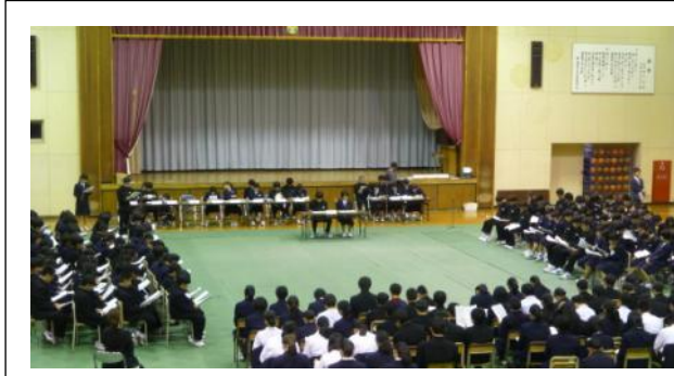
生徒会会則により総会が始まりました。

5月26日(金)、全校生徒による今年度の生徒総会が開催されました。昨年度の活動の報告に加え、これから1年間の生徒会活動の目標や活動方針、生徒会執行部のテーマや各専門委員会の委員長からの活動内容が発表されました。そして生徒会活動予算について審議が行われ、それぞれが承認されました。これに基づいて、三中生徒会は新たなテーマのもとで始動していきます。