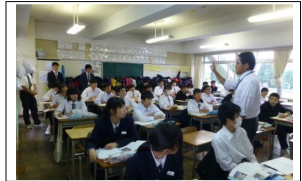
みんな授業に集中しています。