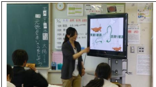
iPad とモニターを使っでの授業の様子です。