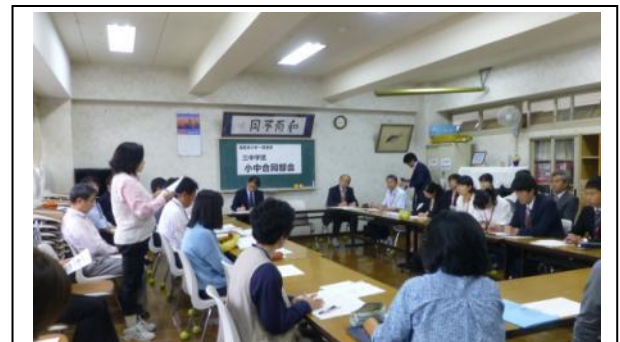
授業の後に今後の方針について協議が行われました。