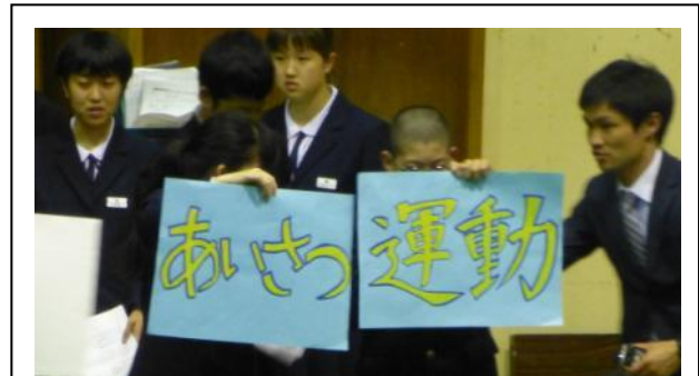
三小でのあいさつ運動も行います。