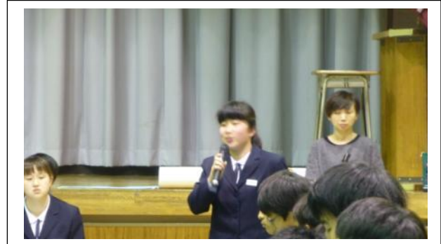
挨拶を述べる生徒会長さん