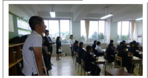
三小の先生方による授業参観