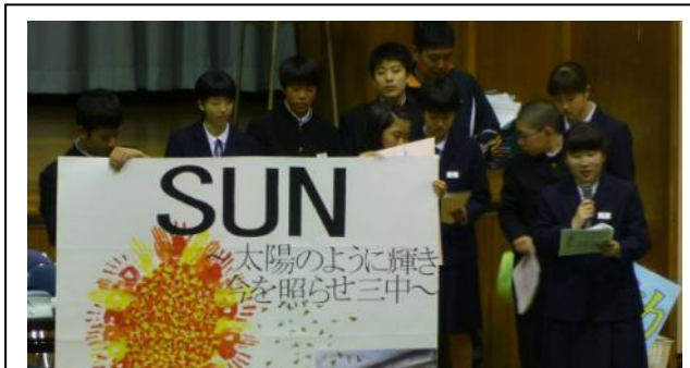
今年度の生徒会テーマ