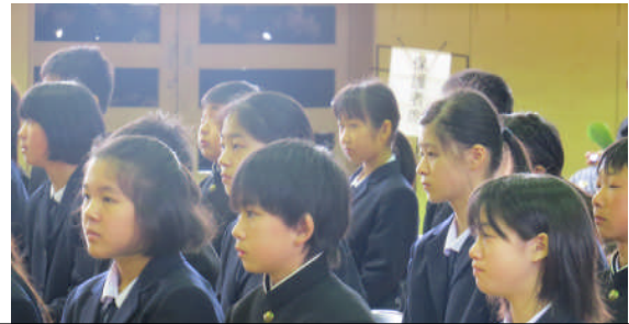
校長先生のお話をしっかりと聞いています。