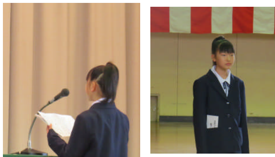
新入生 誓いの言葉