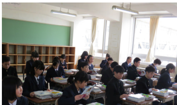
教室に戻って新しい教科書を手に入れました