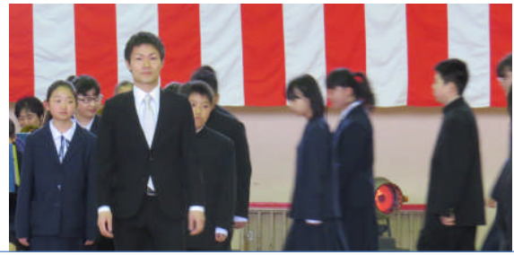
吹奏楽部の演奏に合わせ、緊張しながらの入場です。