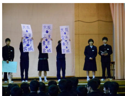
↓オープニングクイズ(執行部)