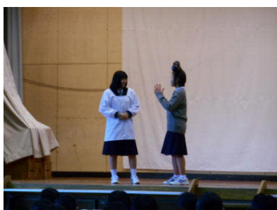
合唱↓ & サザエさん↑(2年)