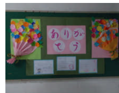
↓心を込めて作った掲示物が校舎中に→