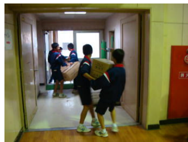
↑支援物資等の運搬訓練の様子