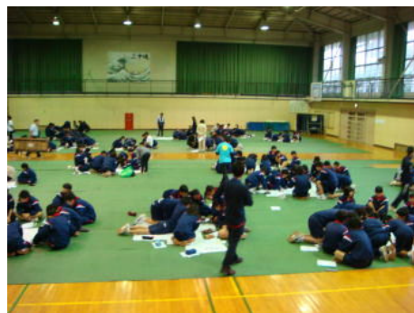
↑↓ハザードマップづくりの様子