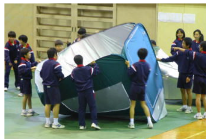
↑パーテーションの設置訓練の様子