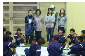
↑皆様にご支援頂きました