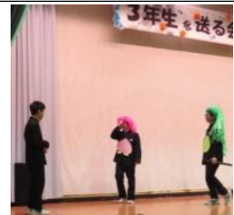
寸劇で会場を和やかに包みます