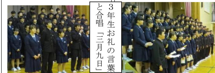
3年生お礼の言葉と合唱「三月九日」