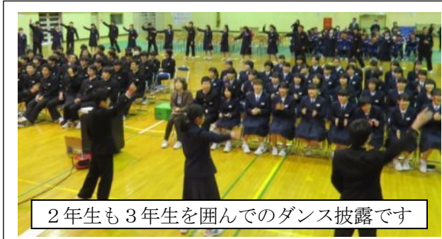
2年生も3年生を囲んでのダンス披露です