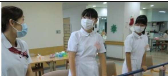
坂病院にて。トリアージや介護等体験を学びました。