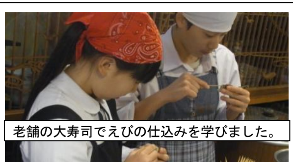
老舗の大寿司でえびの仕込みを学びました。