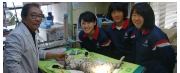
塩浜犬猫病院で院長先生と猫を診察しました。