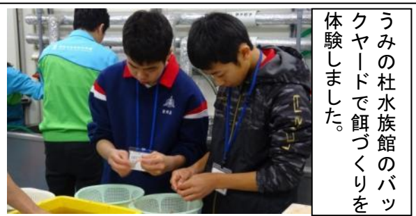
うみの杜水族館のバックヤードで餌づくりを体験しました。