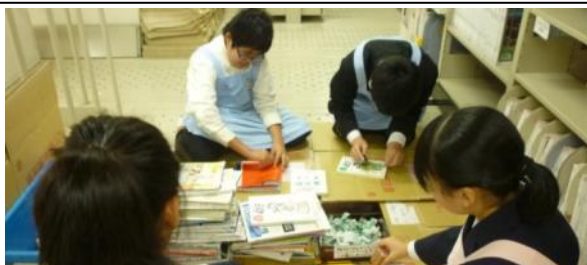
市民図書館では裏方の仕事を体験しました。