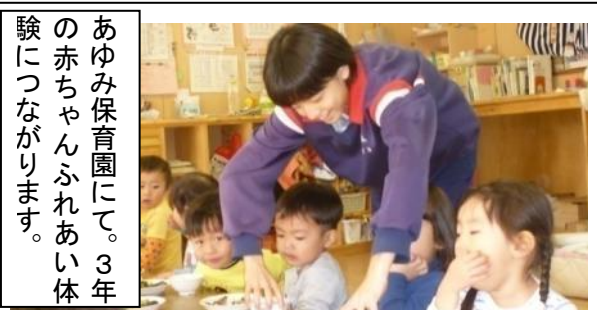
あゆみ保育園にて。3年の赤ちゃんふれあい体験につながります。