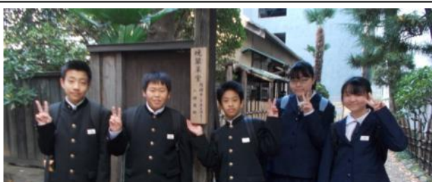
土井晩翠生家、裁判所を見学してきました。