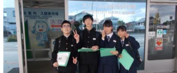
科学館、東北大学理学研究所に行きました。