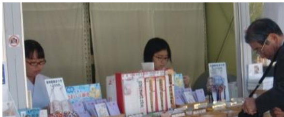
塩竈神社でお札の窓口などを担当しました。

11月14日(火)、15日(水)の二日間にわたって2年生が職業体験学習を行いました。地元の各企業から多大な協力を得ながら、さまざまな職業を体験しました。1学期には岩手県遠野の農家の方々の支援のもとで農業体験学習を行いました。今回は農業とは異なる職業体験への挑戦となりました。12月7日(木)の授業参観では、学んだことがらについてのプレゼン(発表会)を予定しています。各企業の皆さまには大変お世話になり、ありがとうございました。2年生は社会の厳しい現実を知るとともに、仕事をするものの意義と大切さを肌で実感することができました。