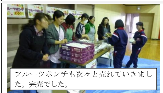
フルーツポンチも次々と売れていきました。完売でした。