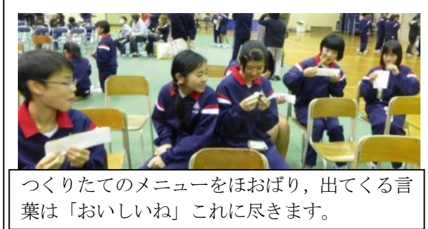
つくりたてのメニューをほおぼり、出てくる言葉は「おいしいね」これに尽きます。