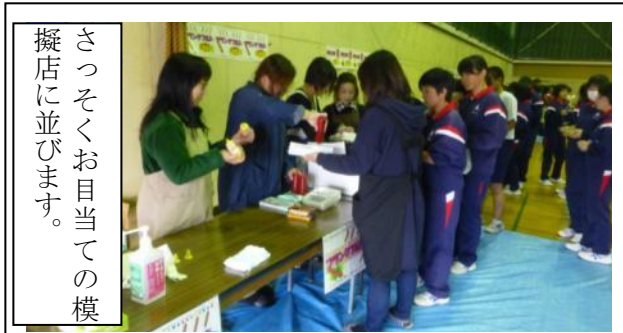
さっそくお目当ての模擬店に並びます。

今年は保護者による模擬店が、やきそば、玉こんに、フライドチキンをはじめ数種類が体育館でオープンしました。またサプライズとして、本部役員の発案で「わたあめ」も提供されました。生徒は午前の授業のあとで体育館に集合し、それぞれが模擬店で買い物と食事を楽しみました。今回の模擬店の売上はこれまでの三中彩で最も高くなりました。ご協力ありがとうございました。