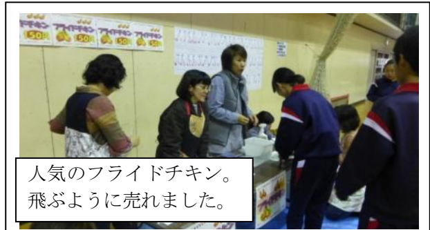
人気のフライドチキン。飛ぶように売れました。