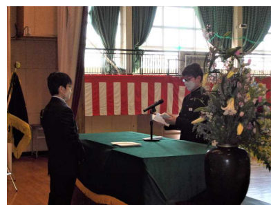
新入生誓いの言葉